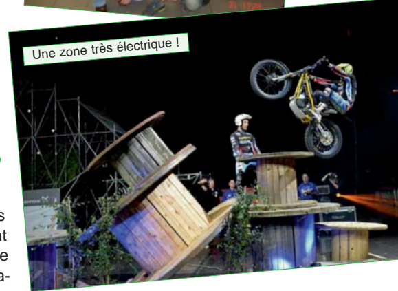
Une zone très électrique !

nes métalliques, échafaudages culminants à plus de 10 m. de hauteur et jets d'eau. La projection des résultats en live sur écran d'eau permettait de suivre en temps réel les