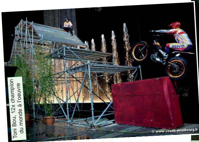
Toni Bou, 12x champion du monde à l'oeuvre

nes métalliques, échafaudages culminants à plus de 10 m. de hauteur et jets d'eau. La projection des résultats en live sur écran d'eau permettait de suivre en temps réel les